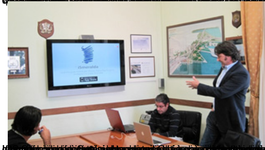
La guida mobile della Sardegna